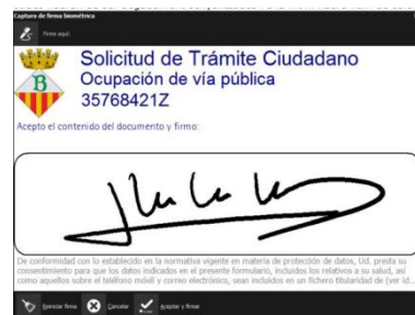
Personalización fondo de la tableta

2. Al pulsar sobre el botón "Firmar", se activa la tableta y muestra al ciudadano los datos necesarios para facilitar la comprensión y la firma del documento.